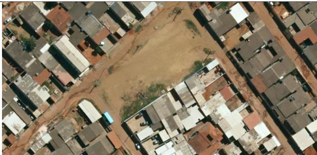
VISTA SUPERIOR GERAL

OBRA: URBANIZAÇÃO SHSN CH 87 - ÁREA ESPECIAL