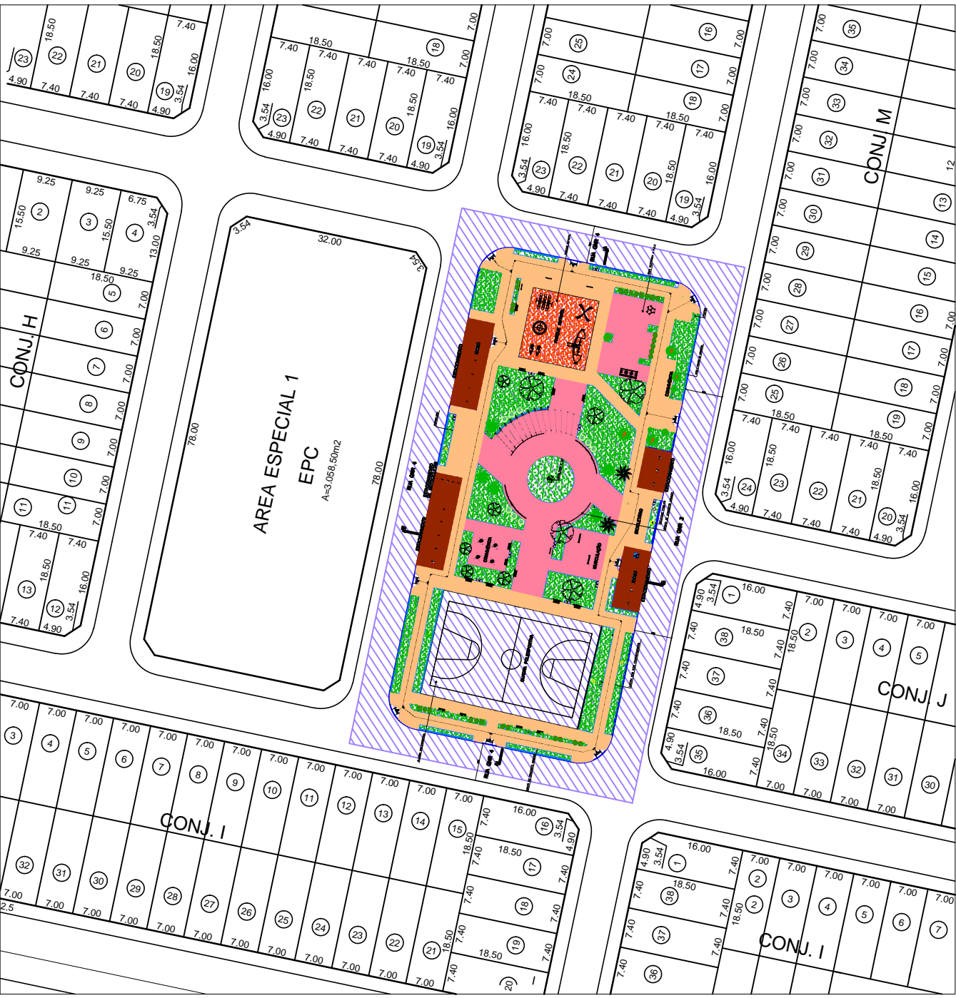
MAPA DE SITUAÇÃO ESCALA 1:1000